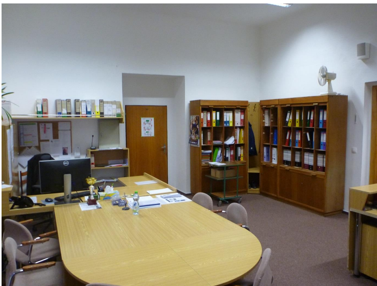
Ředitelna v novém.