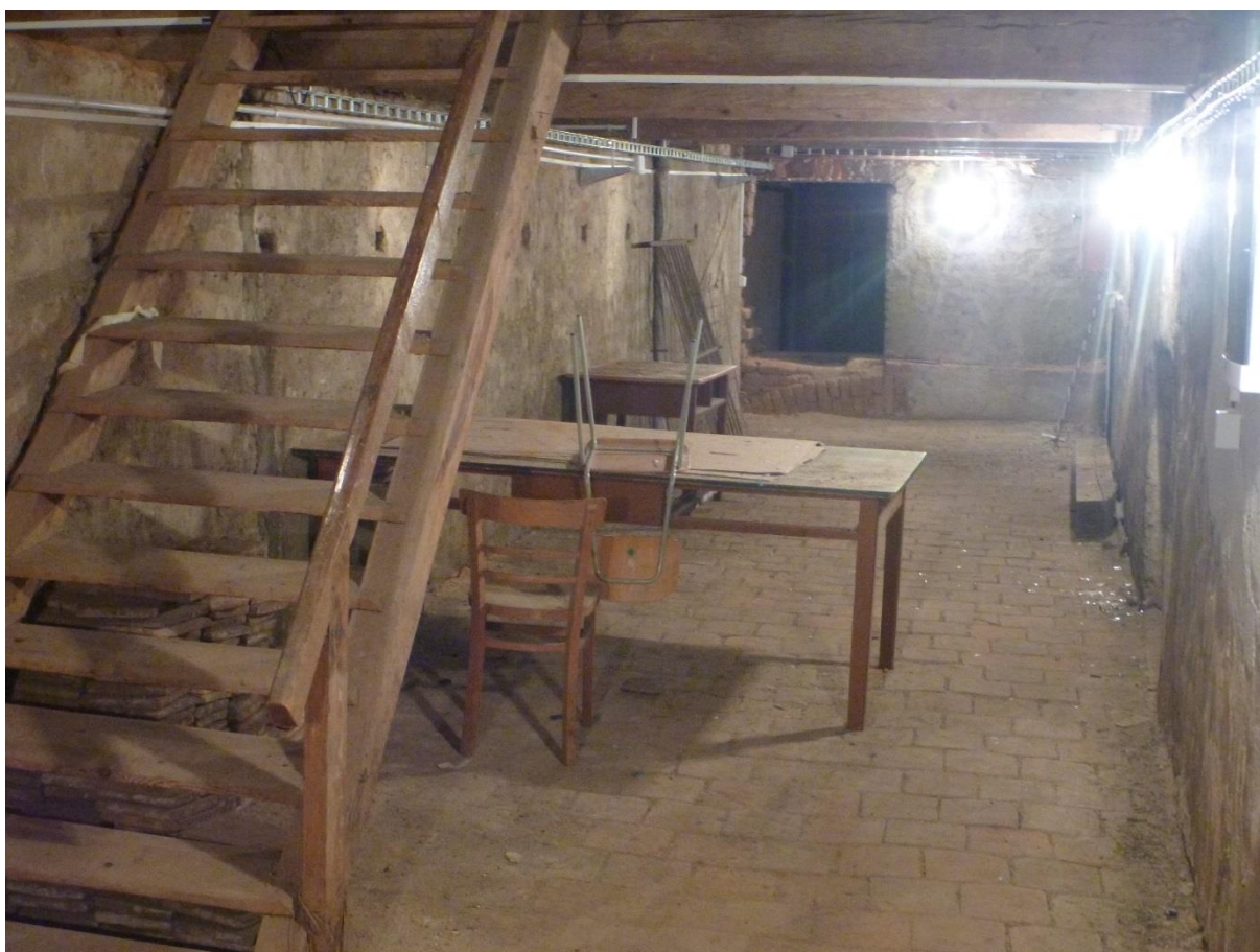
Nové rozvody elektřiny.