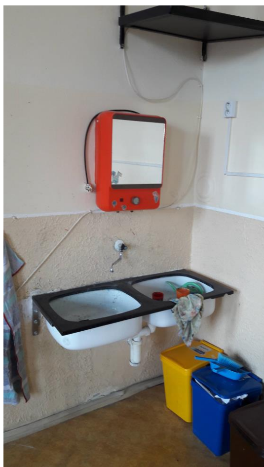
Učebna výtvarné výchovy před rekonstrukcí.