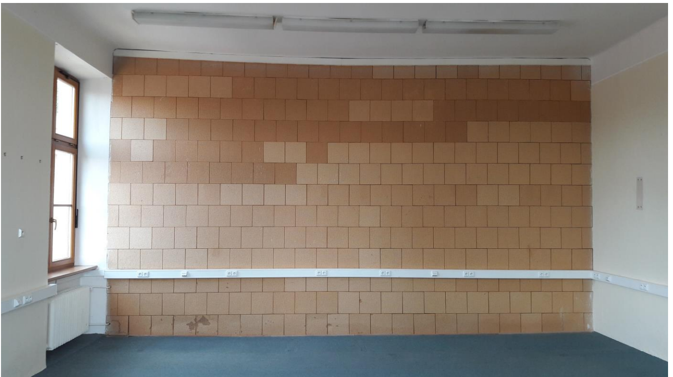
Laboratoř informatiky před rekonstrukcí.